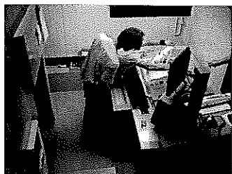
両面 10 色機

創業者である私の父が平成 6 年に他界した後は、バブル後の失われた 10 数年を受注単価の急落と戦いながら生きて参りました。2002 年からは 5 年計画で会社の設備を両面機に入れ替え、CTP のシステムを導入するとともに ISO14001 を取得して、社内改革に取り組みました。現在の設備は 10 色機 1 台、8 色機 2 台、5 色機 1 台、4 色機 1 台(いずれも菊全)です。